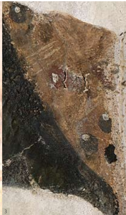
1 - Cathédrale Saint-Maurice, Angers 2 - Église Saint-Martin, Champteussé-sur-Baconne 3 - Ancien couvent des Cordeliers de La Baumette, Angers 4 - Manoir de La Butte, Mouligné